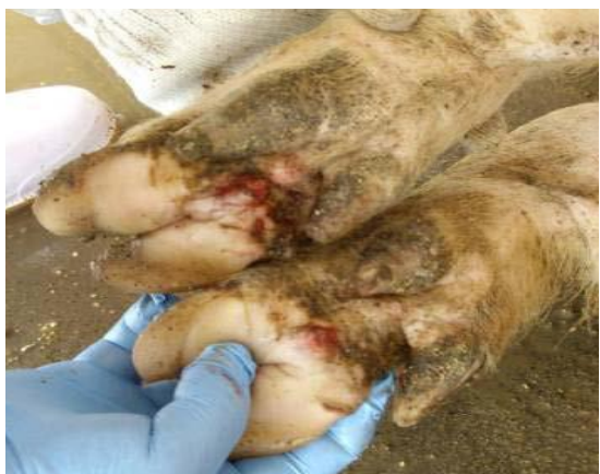
蹄球部皮膚のびらん、潰瘍

口の中、唇、鼻、蹄、乳房の いずれかに 水疱、びらん、潰瘍 または痂痕がみられる。