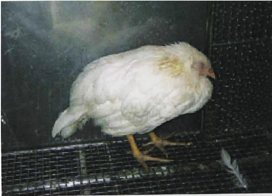
写真1. 感染し、元気をなくした鶏（真瀬昌司原画）