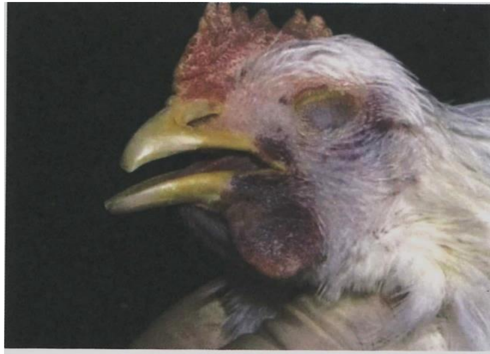
写真4. 宮崎株実験鳥 肉垂のチアノーゼが見られる