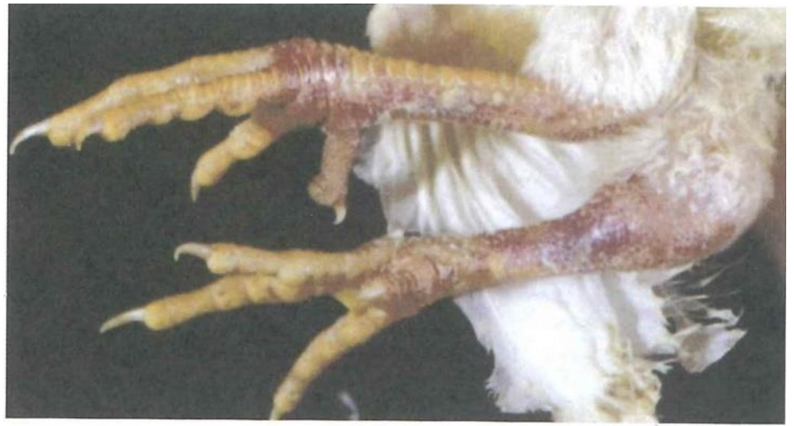
写真3. 脚部の皮下出血（真瀬昌司・谷村信彦原画）