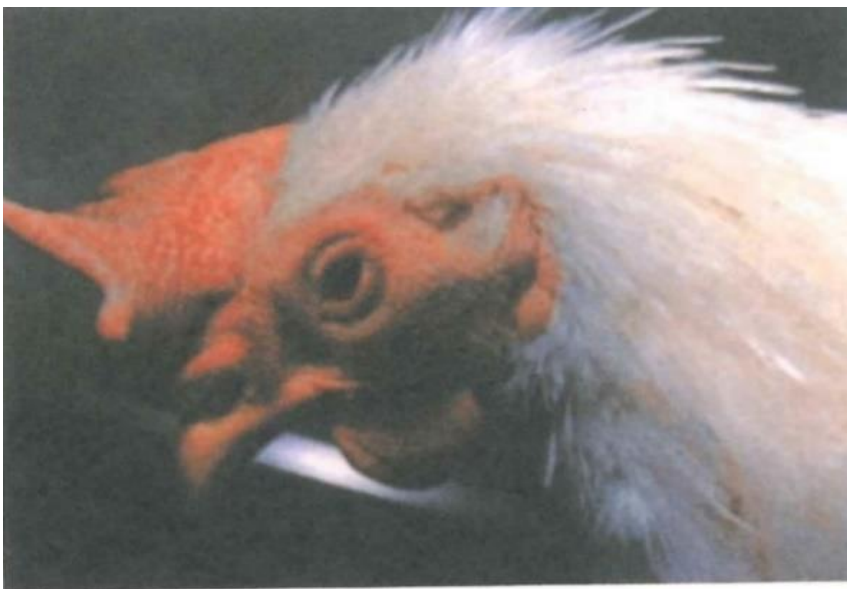
写真2. 突然の沈うつ、すぐ死亡