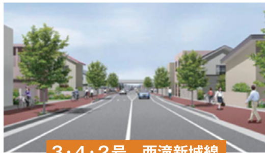
3・4・2号 西滝新城線

当管内では、慢性的な交通渋滞の緩和を図り道路利用者の安全を確保するため、青森市内の2路線で整備を進めています。