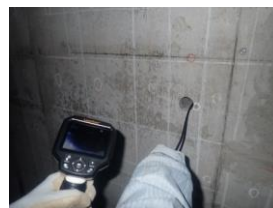
削孔内カメラ確認