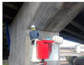
集塵機能付き工具での施工