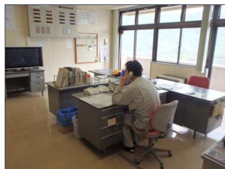
情報伝達訓練の状況