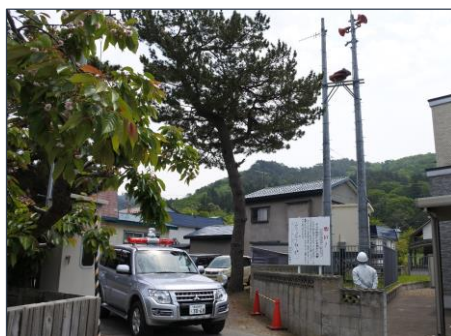
浅虫ダムの警報局（银杏橋）