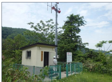
下湯ダムの警報局（大柳辺沢）