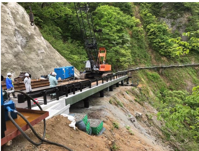
4号工事用道路の施工状況①（5月31日）

現在は、4号工事用道路において、昨年度に製作したメタルロードの据付けに向けて準備を進めているところです。