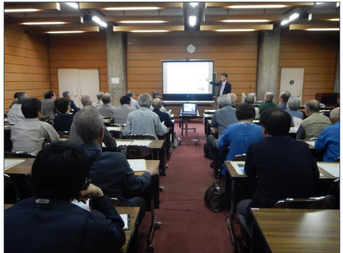
駒込ダム建設事業の説明状況

※青森県県土整備部facebookに5月17日に投稿していますので下記URLからご覧ください。