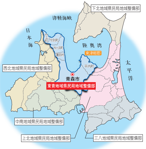
管内市町村勢概要