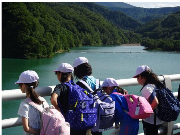
洪水吐からダム湖を望む児童たち（たかい！）