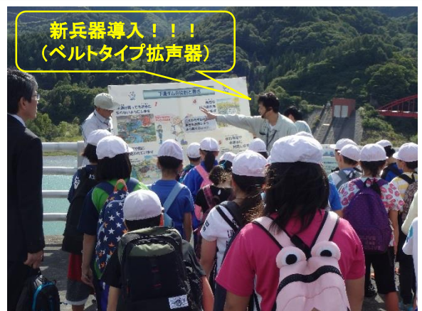
下湯ダムの役割と働きを学ぶ児童たち

統計を取り始めた平成9年度から、今回で90回目の見学会となりました。（今年度4回目）