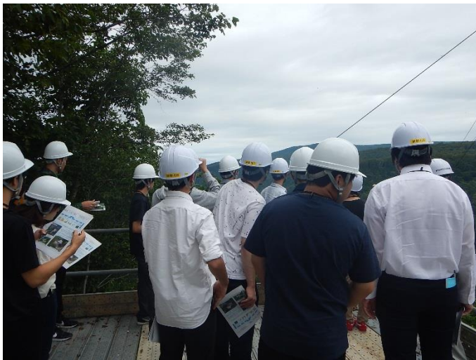
左岸天端部の展望所で事業概要説明

この参加者の中から、ダムに興味を持ち、駒込ダムを担当する方が出てきてくれることを大いに期待しています！！