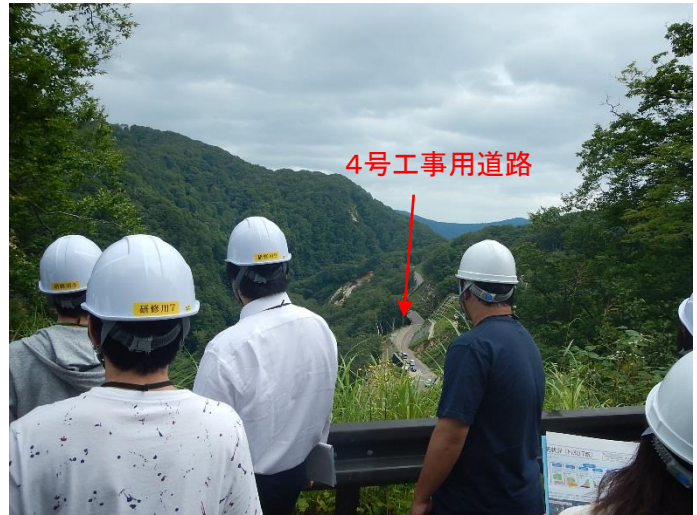
1号工事用道路から工事中の4号工事用道路を見学