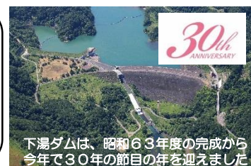
下湯ダムは、昭和63年度の完成から今年で30年の節目の年を迎えました

統計を取り始めた平成9年度から、今回で90回目の見学会となりました。（今年度4回目）