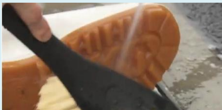
長靴は汚れを落としてから消毒

高病原性鳥インフルエンザの特定症状を呈している 家きんを発見した場合は、 直ちに八戸家畜保健衛生所に連絡してください！