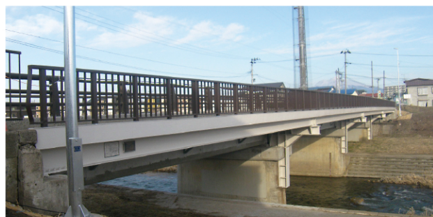
橋梁補修（長寿命化）事業 (石川土手町線・弘前市小栗山【上千年橋】：令和5年3月完成)