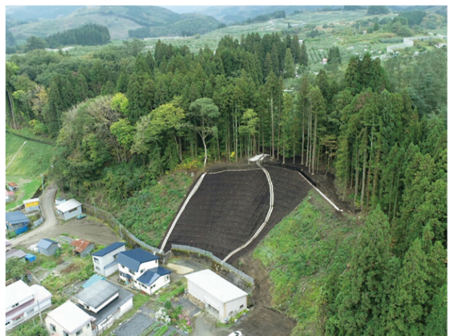
山田2号区域急傾斜地崩壊対策事業