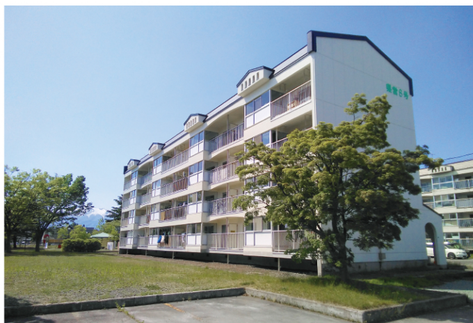
県営住宅 宮園第二団地

また公営住宅法に基づく県営住宅を管内に9団地（約1,200戸）整備しており、計画的に維持修繕工事を行っています。