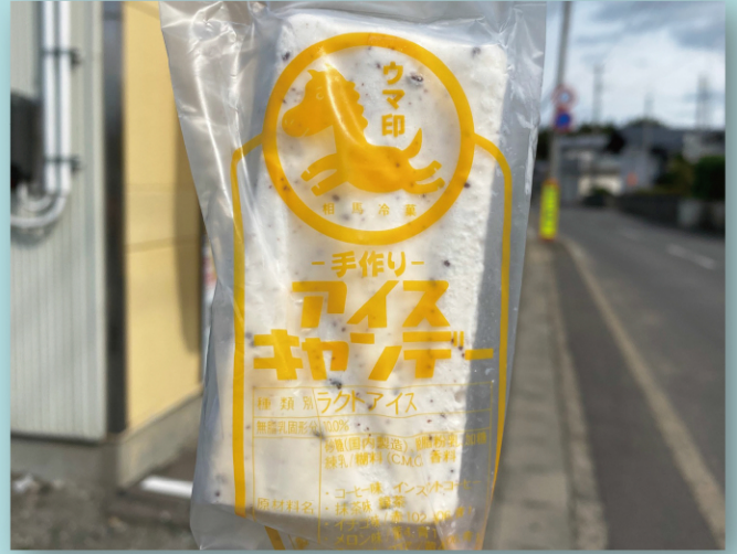
弘前市「悪戸のアイス」