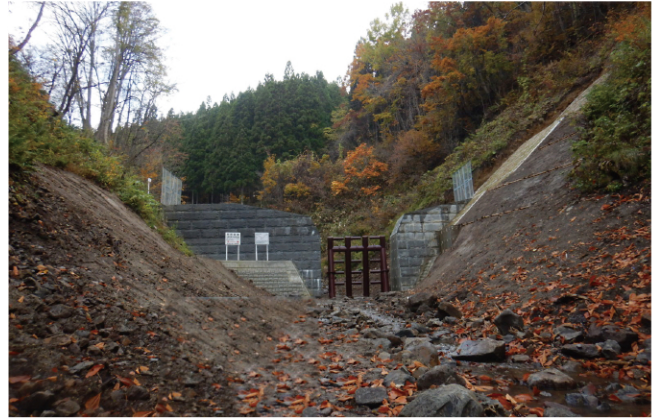
小国沢第2号大規模特定通常砂防工事

令和5年度の砂防事業実績箇所は23箇所を予定しており、事業実施に当たっては防災対策と合わせて、周辺景観や地域整備に調和した豊かな水辺づくりを実施するなど、環境の保全を図りながら進めることとしています。