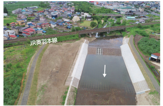
平川広域河川改修事業（大和沢川工区）

令和5年度は引き続き、大和沢川、引座川及び腰巻川について、平川広域河川改修事業を進める予定です。