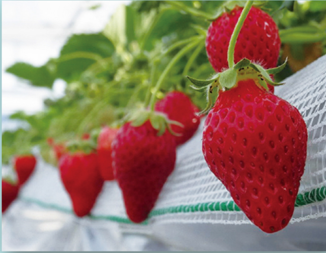
田舎館村「田舎館いちご」