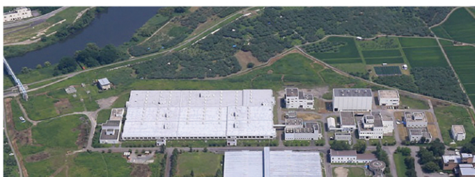
岩木川浄化センター

令和5年度は、岩木川浄化センター及び各中継ポンプ場の設備更新工事・修繕工事の他、管路施設の長寿命化工事を実施する予定です。