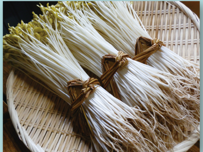
大鰐町「温泉もやし」