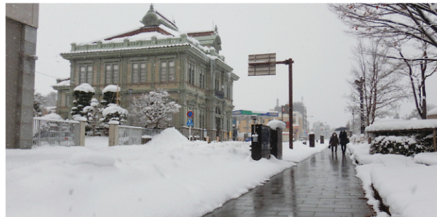
無電柱化事業 + 凍雪害防止事業 (弘前岳参ヶ沢線・弘前市下白銀町工区：令和4年3月完成)

また、橋が老朽化してから架け替えをするのではなく、定期点検を行い、計画的に補修することで長寿命化を図る橋梁アセットマネジメント事業を実施し、橋梁の適切な維持管理・保全に努めています。