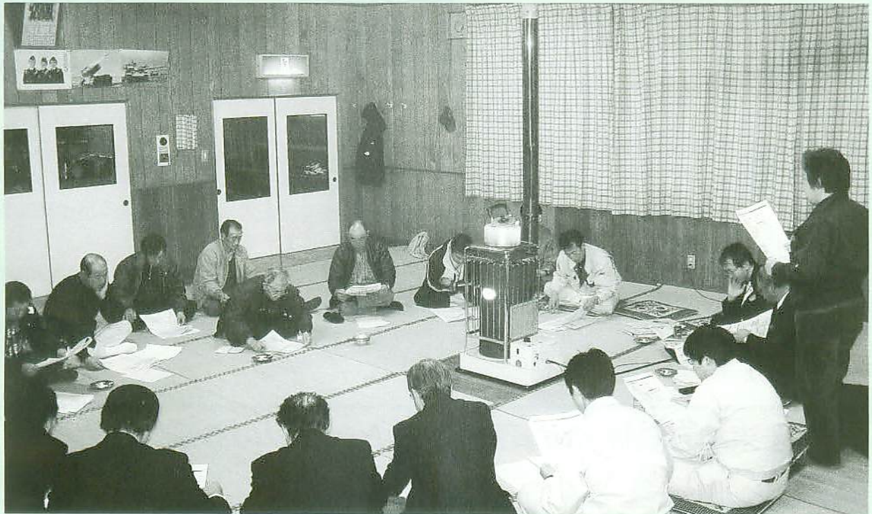
集落営農について説明を受ける皆さん〈中小国地区〉