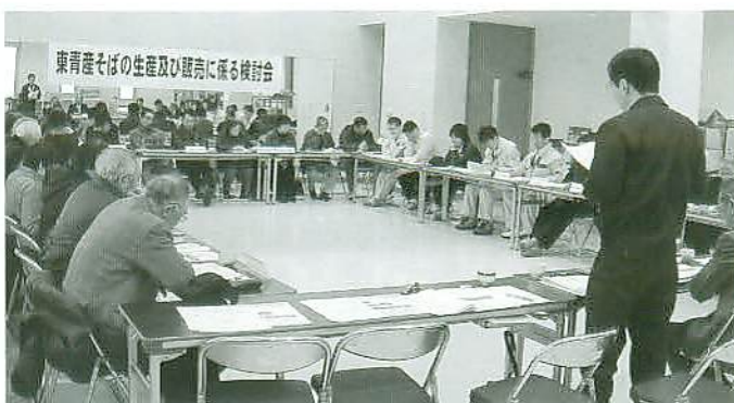
現状報告を受けている参加者

18年度は、東青産そば粉を使用するそば店の掘り起こし、そば店との契約栽培等の推進やそばのオーナー制度等に取り組むこととしています。