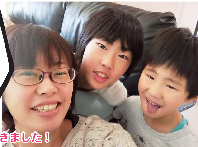
▲佐井村在住4人家族：長女（小5）、長男（年中組）