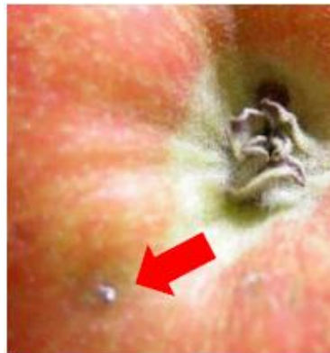
滴は白く乾燥して、しばらくの間は、果皮上に残る