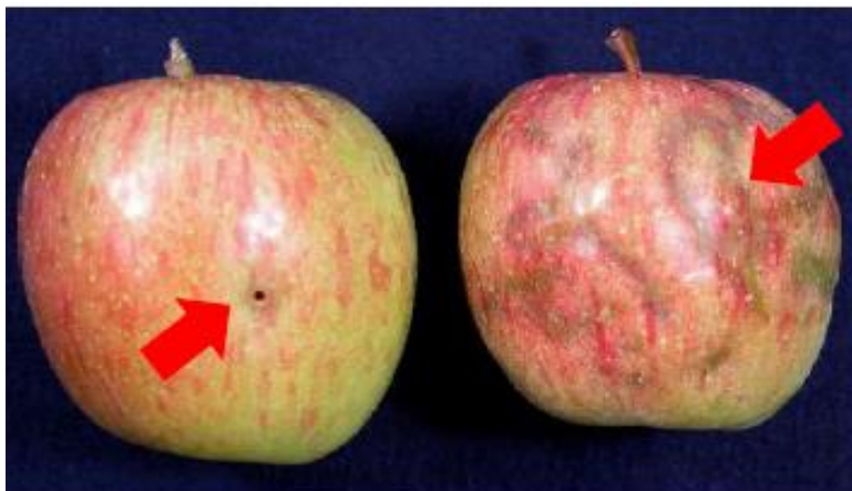
脱出痕(左)と潜入(果皮近くを食い荒らした)痕(右)