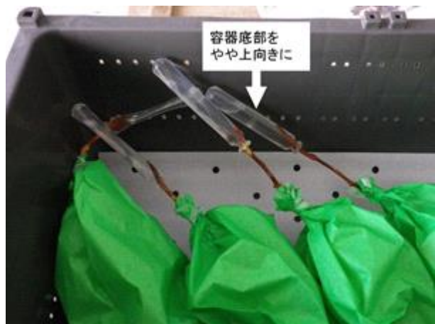
貯蔵コンテナによる保管