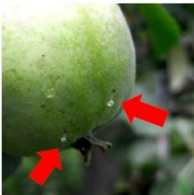
食入されると滴が出る