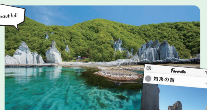
#大自然的迫力ある造形美 仏ヶ浦 A-3

巨岩・奇岩が並び、極楽浄土を思わせる神秘的な景色。国の名勝及び天然記念物。 ◆問: NPO法人佐井観光協会 0175-38-4515 ◆交通: JR下北駅より徒歩約2時間 / バス停「むつ」より下北交通バス・佐井行き約2時間、「佐井」下車後徒歩約2分、佐井港より観光船で約30分