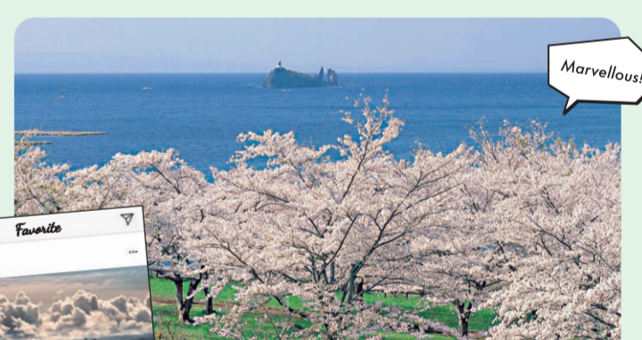
#陸奥湾と鯛島が一望 愛宕山公園 A-5

巨岩・奇岩が並び、極楽浄土を思わせる神秘的な景色。国の名勝及び天然記念物。 ◆問: NPO法人佐井観光協会 0175-38-4515 ◆交通: JR下北駅より徒歩約2時間 / バス停「むつ」より下北交通バス・佐井行き約2時間、「佐井」下車後徒歩約2分、佐井港より観光船で約30分