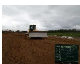
【GNSSによる盛土締固め】