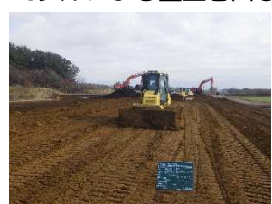
【MCブルによる盛土巻出し】