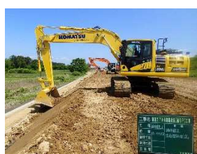
【MCバックホウでの法面整形】