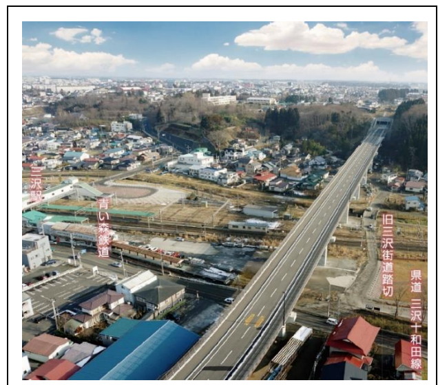
【現況写真(三沢大橋)】