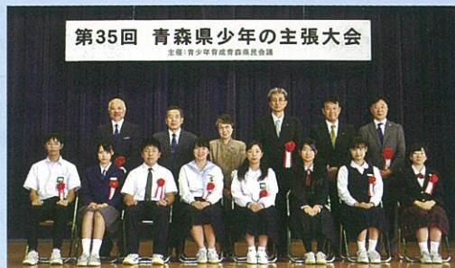
9/27 青森市立沖館中学校にて開催