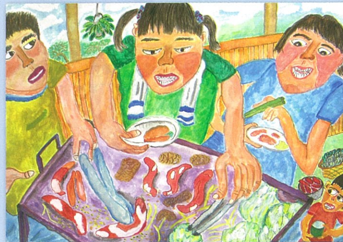
平成25年度「家庭の日」 図画・ポスターの部 最優秀賞