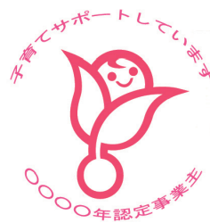
(次世代認定マーク「くるみん」) 子育て支援に関して一定の要件を満たすと認定された企業が使用できるマークです。