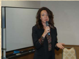
あん・まくどなると 国連大学金 沢・石川ユニット長 H22第3回