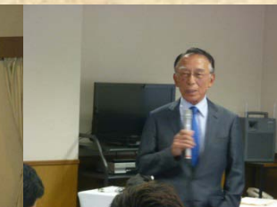
野田一夫 日本総合研究所会長 H21第2回、H23第1回、H24第1回