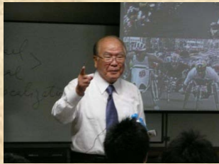
平松守彦 元大分県知事 H20第1回, H21第2回