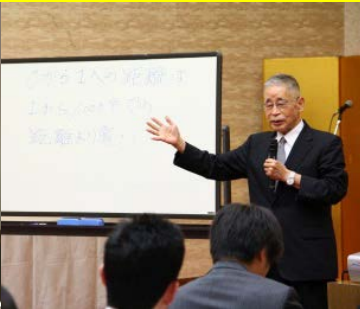
鍵山秀三郎氏 (株イエローハット創業者)