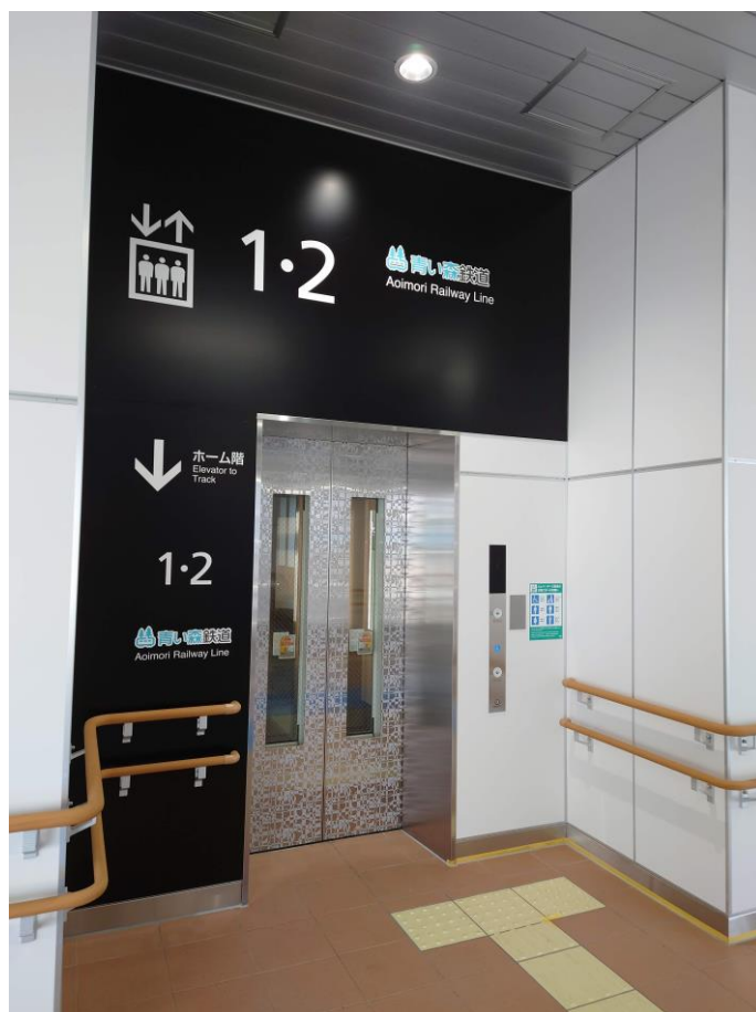
バリアフリー設備（E V）整備（青森駅構内）