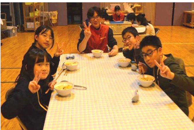
鍋焼きうどん、すごくおいしかった!(2日目)