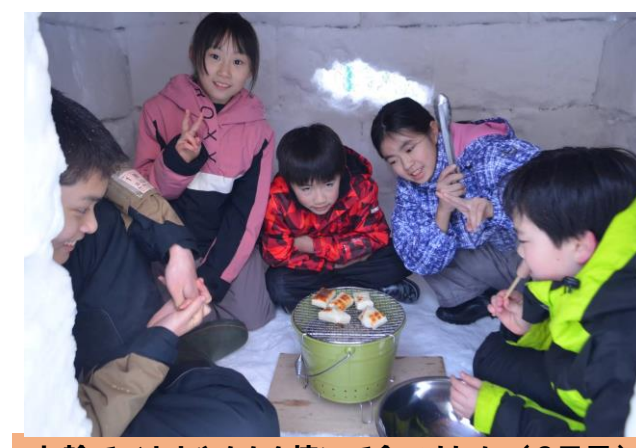
七輪でバナナやもちを焼いて食べました。(2日目)