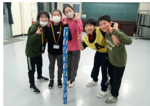
館内QRゲーム! 指令の缶積み成功(1日目)