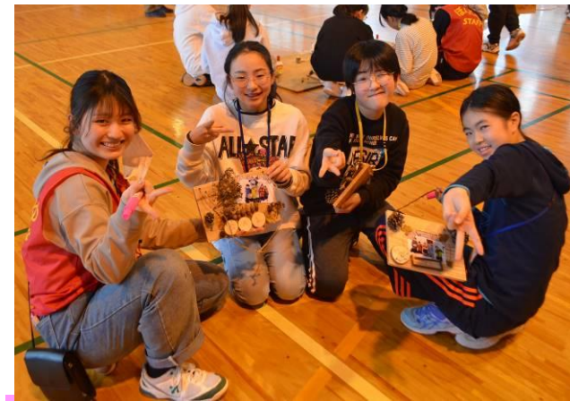
思い出クラフト「森からのプレゼント」完成(3日目)

参加者のアンケートには、「かまくら作りで、雪ブロックを積み上げていくのが、自分たちの成長が目に見えるような感じでうれしかったし、楽しかった。」「夜のかまくら祭りで、ゲームをしたり、マイムマイムを踊ったりしたのが楽しかった。」といった喜びあふれる感想がたくさん書かれていました。最後には、別れを惜しむほど仲が良くなっていた参加者のみなさん。新しい友達ができただけが、一番の思い出であり「宝物」になっていたと思います。またいつかぼんじゅのイベントで再会できることを楽しみにしています。