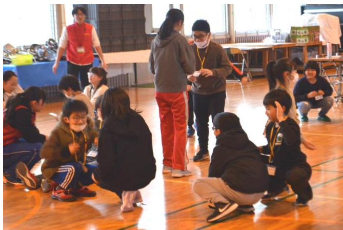
仲間づくりゲームで緊張がほぐれました(1日目)