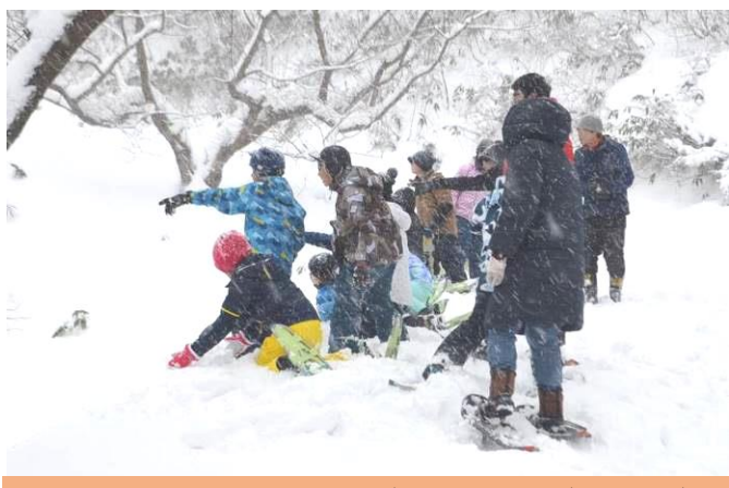
スノーシューハイク 雪まくり挑戦!(2日目)