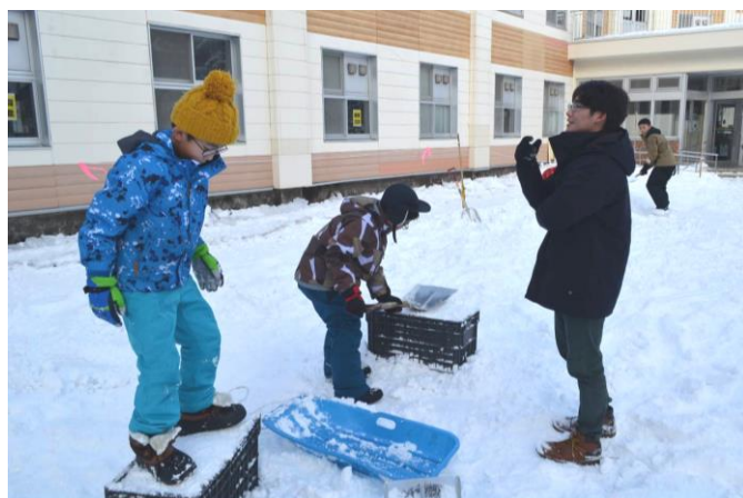
かまくら基地作りスタート! 雪ブロック作り(1日目)