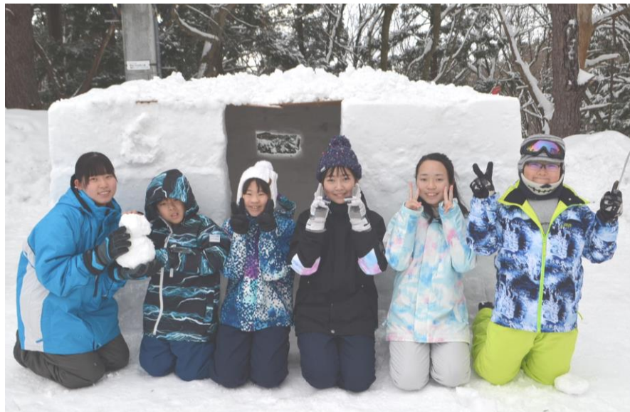
かまくら基地完成写真 みんなでピース!(2日目)

完成後は、「かまくら基地」の中で、七輪を使って、もちやバナナを焼いて食べました。夜は、かまくらにキャンドルを灯し、みんなでゲームをしたり、マイムマイムを踊ったりして盛り上がりしました。