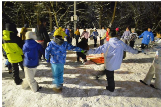
夜のかまくら祭り みんなでマイムマイム!(2日目)