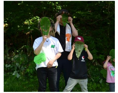
野外活動（自然散策：ホオのお面）