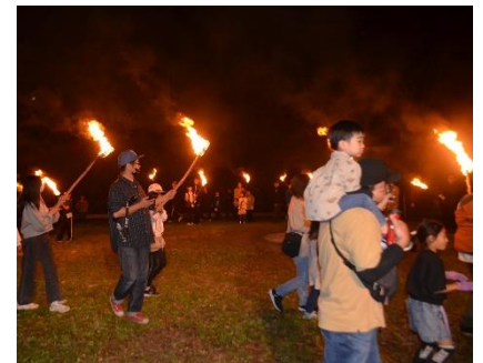
キャンプファイヤー体験