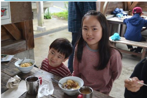
野外炊事（朝食：さばター飯とみそ汁）

【主な内容】 テント撤収、野外炊事(さばター飯とみそ汁)、創作(森からのプレゼント)