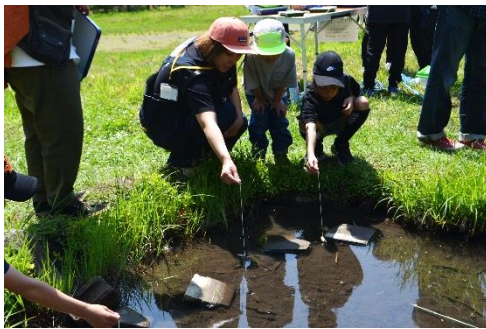
野外活動（生き物観察：ザリガニ釣り）

【主な内容】 野外活動、テント設営、野外炊事(ポトフとホットサンド)、キャンプファイヤー