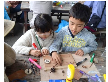
創作（森からのプレゼント：製作）

アンケートでは、「ただファミリーでキャンプを楽しむというだけでなく、テントの使い方等、とても詳しく教えていただき、とても勉強になりました」などの声が聞かれました。このファミリースプリングキャンプを機会に、様々なアウトドアを家族で楽しむきっかけとなればと思える1泊2日となりました。