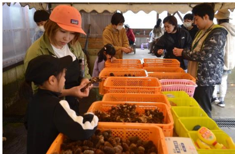
創作（森からのプレゼント：材料選び）