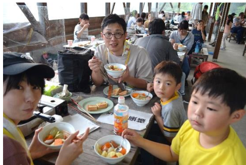
野外炊事（夕食：ポトフとホットサンド）