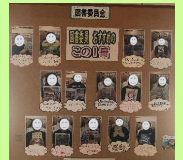
（４）図書委員の本紹介