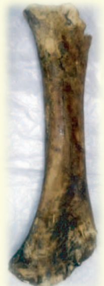
ナウマンゾウ大腿骨化石

昭和48(1973)年、本県初の総合博物館としてオープンした当館は、平成25年9月で40年の節目を迎えました。この間、県民のみなさまからお寄せいただいた資料は、10万点程にのぼります。これらの資料は、郷土の姿をものがたる貴重な財産であり、後世に向けて確実に保存し継承していくことはもちろん、展示や教育、研究など、様々な機会や場面を通じて、広く活用させていただいております。