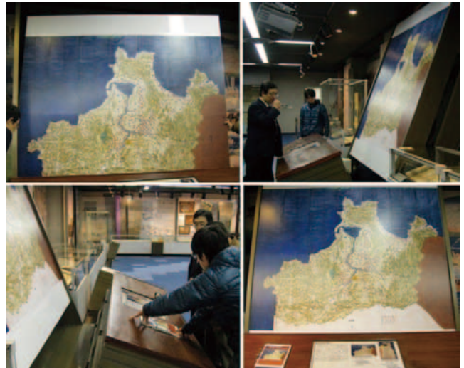
「陸奥国津軽郡之絵図」大型パネルの取り付け