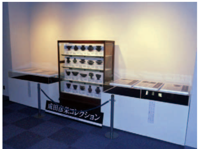
展示作業中の「成田彦栄コレクション」コーナー