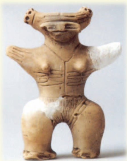
鱒ヶ沢町大曲遺跡