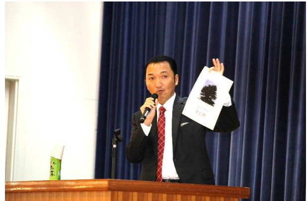
木造高等学校での講話の様子