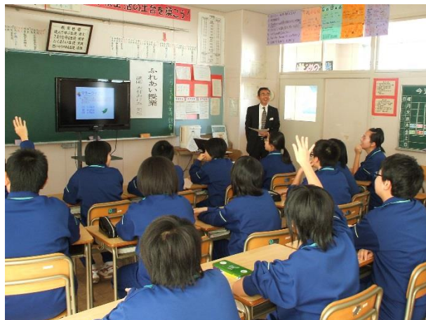
マネースクールの様子