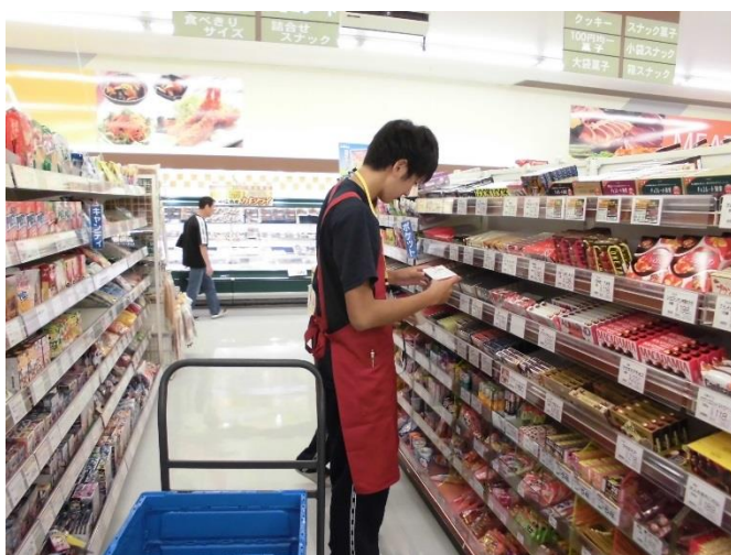
青森県立青森商業高等学校インターンシップの様子