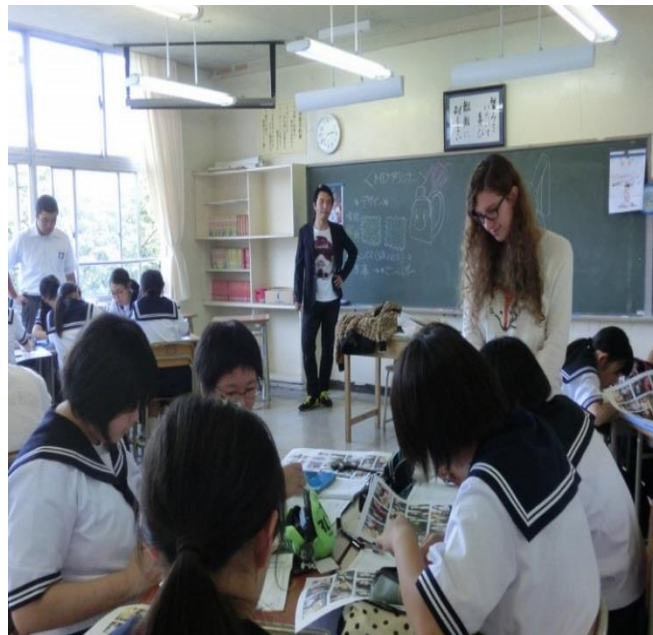
青森市立西中学校 職業講話・出前授業の様子