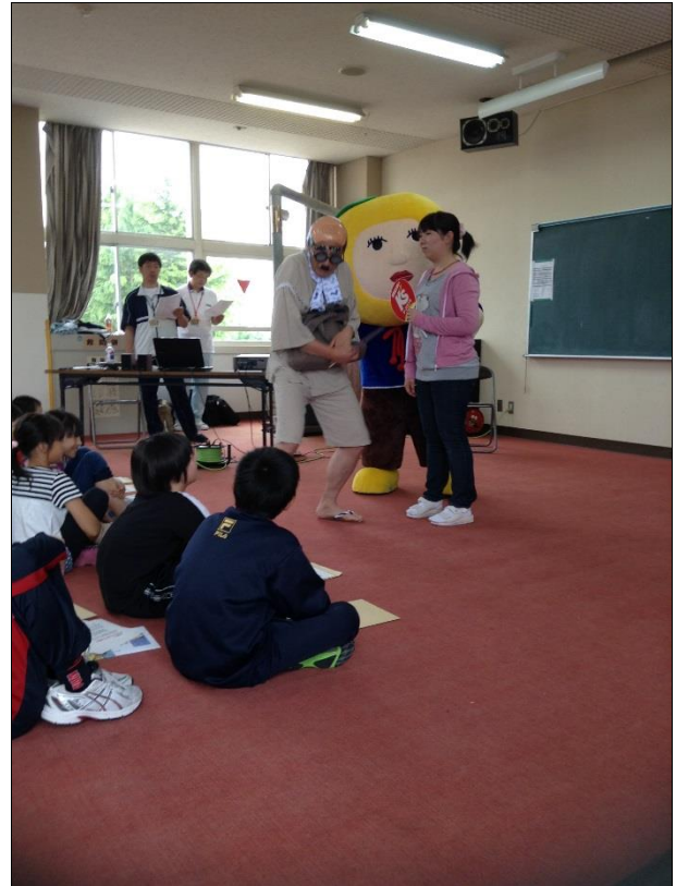
ユメココ教室での講話の様子