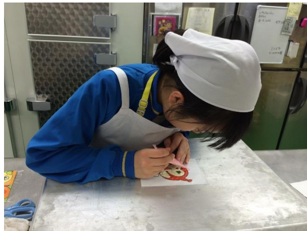
碓ヶ関中学校職場体験受入の様子（H27年度）