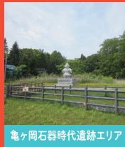
亀ヶ岡石器時代遺跡エリア

田小屋野貝塚出土の人骨や、亀ヶ岡出土の藍胎漆器を始め、つがる市内の出土品等を展示しています。遮光器土偶の精巧なレプリカや復元竪穴住居も見どころです。