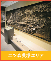
二ツ森貝塚エリア

小川原湖を望む高台にある明治時代から知られる東北有数規模の貝塚です。上層と下層で貝の種類が変わるなど縄文時代の環境の変化がよくわかります。