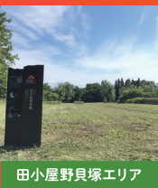
田小屋野貝塚エリア

是川石器時代遺跡では、漆製品や土偶が多数出土しました。低地からは水場が見つかるなど、当時のムラの様子がよくわかる遺跡です。是川縄文館では、是川や風張遺跡の出土品展示をとおして、縄文の精神世界を体感できます。国宝「合掌土偶」も展示しています。