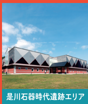
是川石器時代遺跡エリア

岩木山麓のストーンサークルで、冬至の太陽が山頂に沈むのを望む場所に作られました。直径約50メートルです。祭祀に使われた円盤状石製品が出土しました。