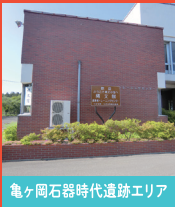
亀ヶ岡石器時代遺跡エリア

大型の遮光器土偶「しゃこちゃん」が出土したことで有名です。台地には多数の墓が作られており、大規模な共同墓地でした。墓からは多くの副葬品が出土しました。