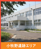
小牧野遺跡エリア