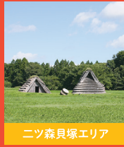
二ツ森貝塚エリア

大平山元遺跡では日本最古級の土器が出土しました。土器は定住の開始を示し、縄文時代の始まりを考えると重要です。石器も出土し、弓矢の使用も開始しています。むーもん館では、縄文時代の始まりを示す「無文土器」(北東アジア産)や、旧石器時代時代から縄文時代の移行がわかる、石器などの資料を展示しています。