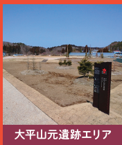
大平山元遺跡エリア

亀ヶ岡石器時代遺跡出土の個人所蔵の土器や石器、土偶など、様々な考古資料を展示しています。藍胎漆器や漆塗り土器、多様な石器などからは、縄文時代の高い技術や精神性が感じられます。