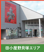
田小屋野貝塚エリア

数少ない日本海側の貴重な貝塚です。ヤマトシジミが大半でイルカやクジラの骨も出土しています。ペンケイガイ製貝輪の制作場所とも考えられています。