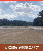
大森勝山遺跡エリア