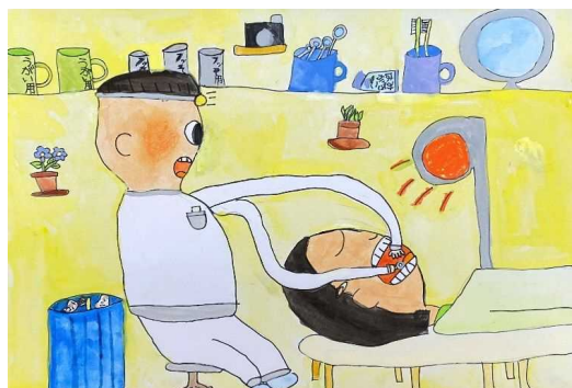
小学校低学年の部