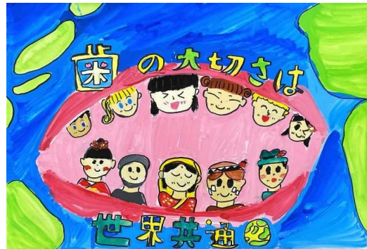
小学校高学年の部