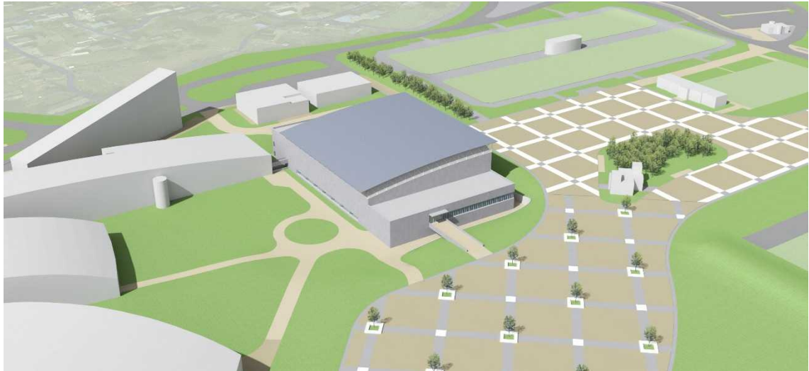
南西側鳥瞰イメージ

マエダアリーナの25mプール部分の屋根は、新水泳場に向かって勾配がとられており、新水泳場の西側に雪が落下する。このため新水泳場の25mプールと正対する部分は陸屋根とすることで、西側に雪を落とさない計画とする。