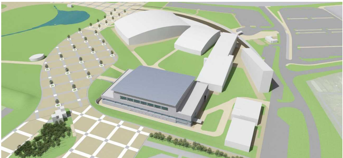
北東側鳥瞰イメージ