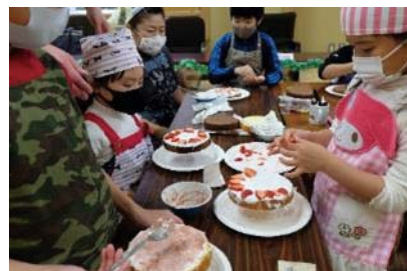
ケーキのデコレーション