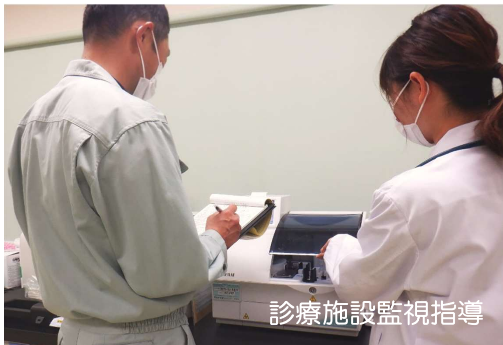
診療施設監視指導