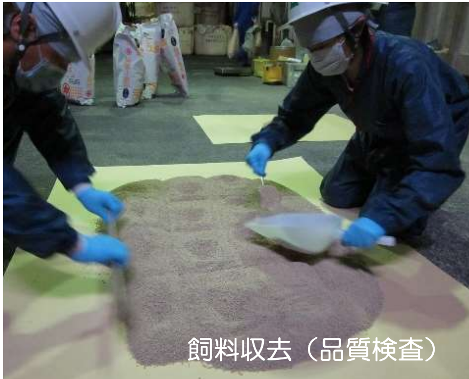
飼料収去（品質検査）

安全な畜産物が生産されるよう、飼料の安全確保を図るために、飼料の製造・販売業者の立入検査及び飼料の品質検査を行います。