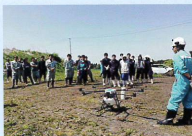
ドローンの実演会