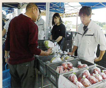
昨年度の販売風景

( https://www.pref.aomori.lg.jp/soshiki/nourin/einodai/daichan.html )