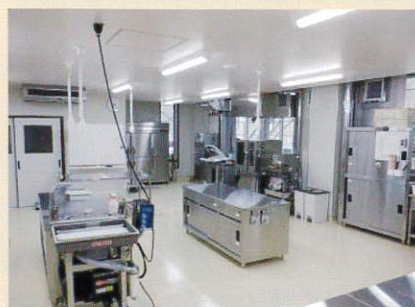
新しい加工実習室

授業では専門知識を有する外部講師を招き、商品化に関わるマーケティングや経営管理、食品衛生等を習得します。