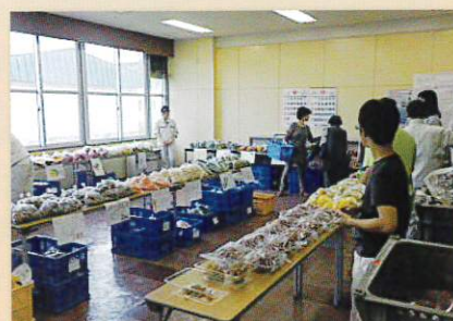
雨天時は室内で開催