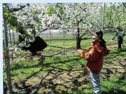
おうとうの授粉作業

2学年12名、1学年8名です。うち女子が各学年1名と 少ないので一部学生から「女子求む」の意見が…。りんご、 特産果樹の生態、栽培、防除、収穫・調製、出荷、剪定、 経営について幅広く学んでいます。2学年は、プロジェク ト学習を中心に主体的に取り組んでいます。近年、補助労 働力不足が問題になっていることから、りんごの摘果や袋 かけ、シャインマスカット、おうとうなどの省力化技術と いったプロジェクト学習に取り組んでいます。