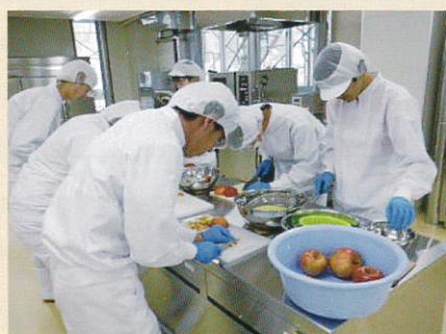
「りんごシロップ漬」加工実習