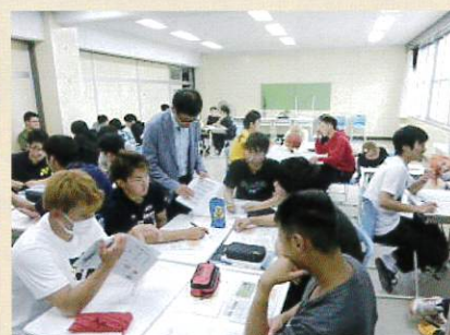
「マーケティング論」の授業風景