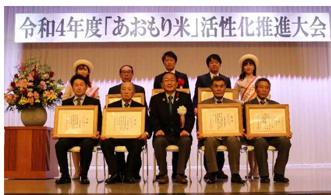
昨年の受賞者の皆様

【後援】 全国農業協同組合連合会青森県本部 青森県米穀集荷協同組合 青森県米穀協議会 青森県産米需要拡大推進本部 公益社団法人青森県農産物改良協会