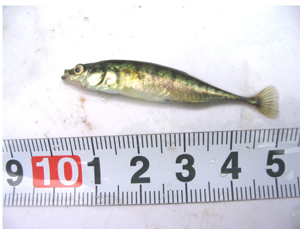
イバラトミヨ(調査地点 3) (青森県:重要稀少野生生物)