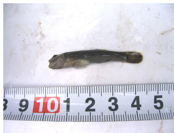
トウヨシノボリ(調査地点 3)