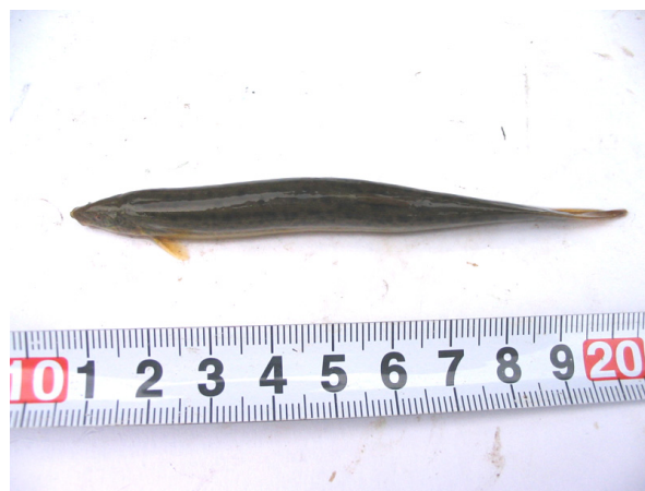
ドジョウ(調査地点 3)