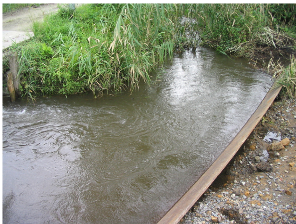
調査地点 3 (H17.9.17調査)