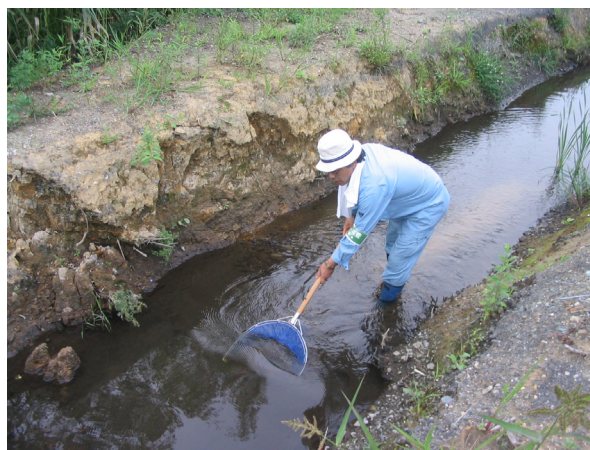
調査地点 5 (H17.8.28調査)