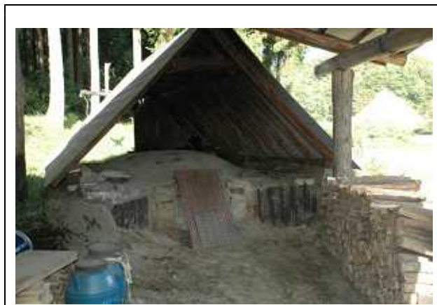
対象農用地内に建設した炭窯