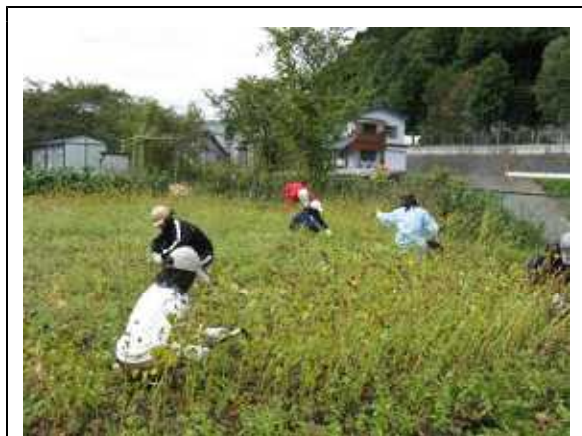
小学生によるそばの収穫体験

これらの活動に加え、当協定代表者がインターネット上にブログ「そば好房 鬼蓮庵 (アドレス: http://onibasuan.blog87.fc2.com/ )」を開設し、集落協定活動を含む、集落の様子等の情報を随時発信している。