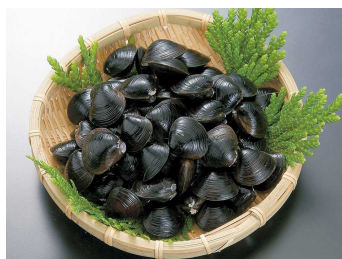
十三湖産大和しじみ 小川原湖産大和しじみ