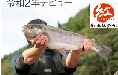
サーモンの新品種「青い森紅サーモン」