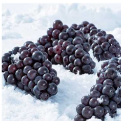
つるたスチューベン