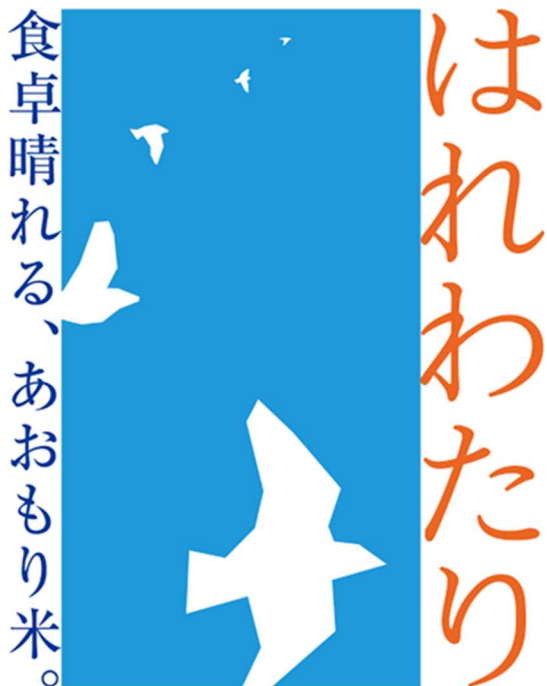
お米の新品種「はれわたり」