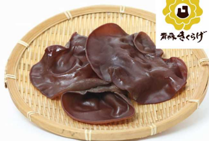
キクラゲの新品種「青森きくらげ」