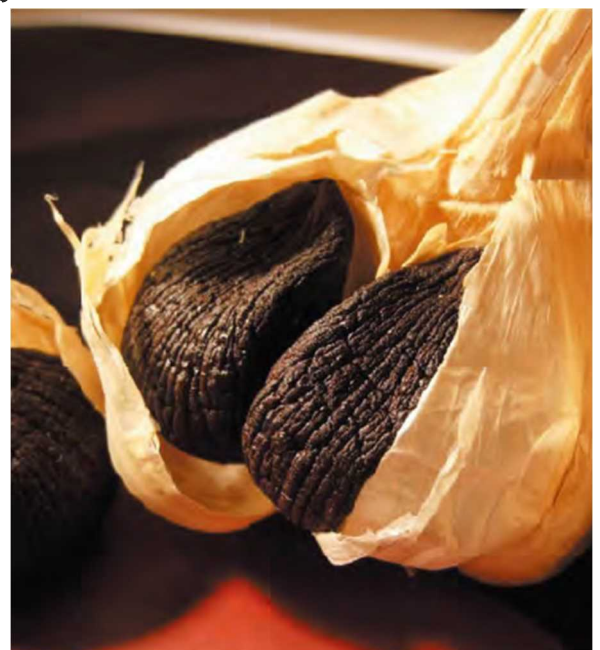
青森の黒にんにく

地理的表示(GI): その地域ならではの自然的、人文的、社会的な要因の中で育まれてきた品質、社会的評価等の特性を有する産品の名称を、地域の知的財産として保護する制度