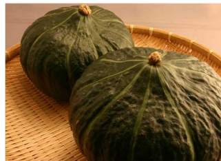
一球入魂かぼちゃ