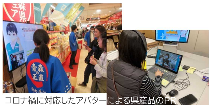
コロナ禍に対応したアバターによる県産品のPR