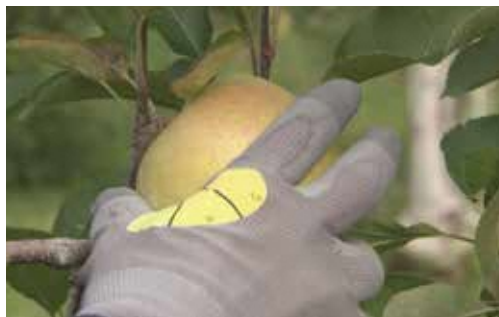
王林の場合、4から5が収穫適期です