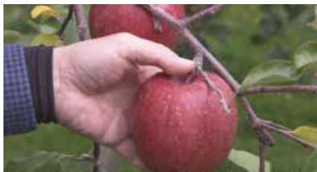
果実を「引っ張る」ではなく「持ち上げる」