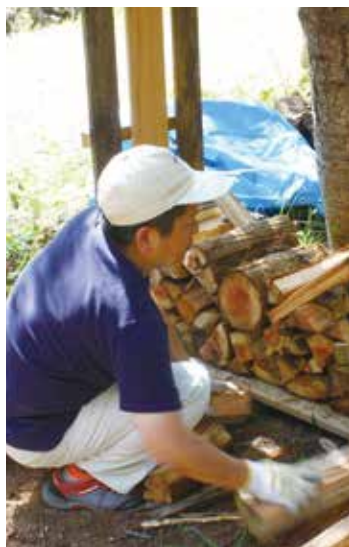
薪積みアートに挑戦するパパへ薪を運ぶお嬢ちゃん