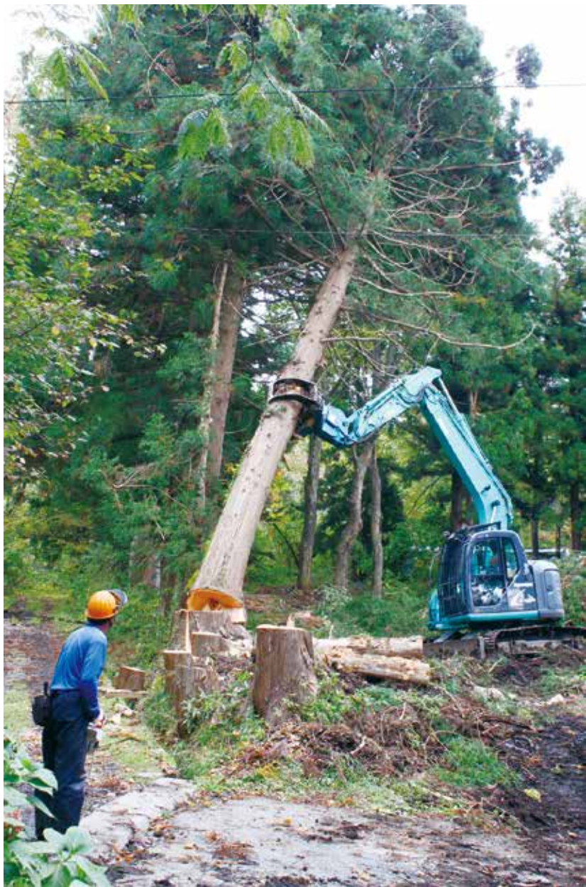
屋敷の手前から奥へ順々に木を伐り倒していく

下見に行くと、雑木林の中に使えそうな良い広葉樹があった。住宅地にも「小さな山」があつたのである。