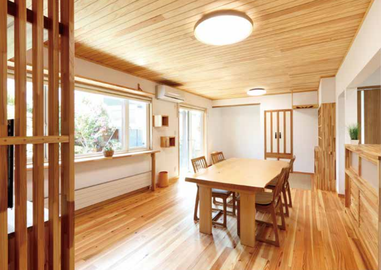
リビングの床・天井・取付の建具にはスギが使用されている。壁面に設けた飾り棚のような箱は5匹の愛猫のキャットウォーク

す。床と壁との取り合い部分、つまり床タルキに入れた断熱材と壁に入れたグラスウール断熱材の間にわずかな隙間があつて、そこから床下の冷気が入り込んでくるわけです。今回その隙間はすべてしっかりと断熱材を充填して塞ぎました。