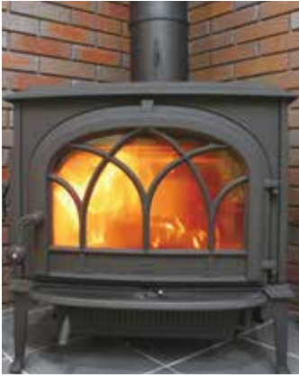
中古住宅を解体した木材を燃やしているという薪ストーブ

床板の柔らかな感触が足裏に新鮮でした。話を進めていた住宅会社の家では表面はピカピカだけど堅くて冷たい合板