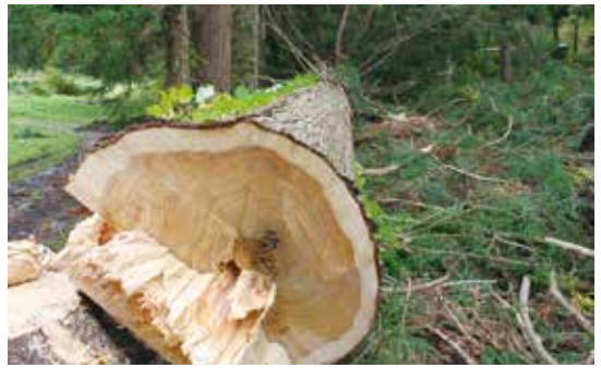
倒してみたら中に一部腐れがあった

でもケヤキとかクリとか、オーク、カツラ、イタヤなどいろいろある。それらを建築用材として使うためです。買い取る金額で、スギを伐り倒す費用は捻出できるから持ち出しはない。 なぜ買うかという点、ロング、つまり長尺ものを取るのが最大の目的なのです。普通、業者は山で4メートルごとに玉切りをするが、立木の段階で買い取ってしまうと、6メートルに切ろうが8メートルにしようがこちらの自由で、だからロン