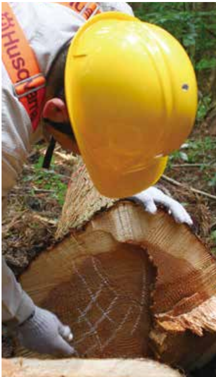
伐り倒したスギの断面に名前を記す