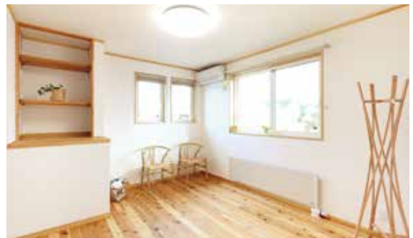
扉を開け放すと大きなスペースとなる2室の洋間