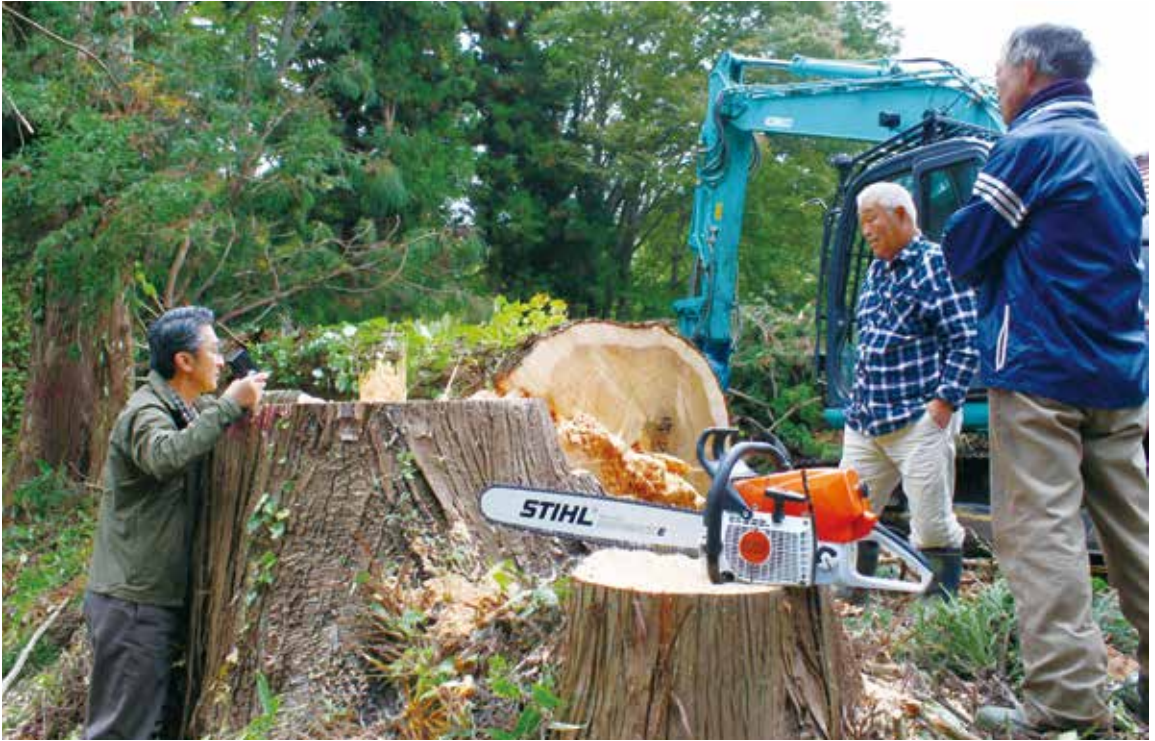
伐った丸太なら内部が見えるが、立木で買うとそれが確認できないので難しさがあるという

でもケヤキとかクリとか、オーク、カツラ、イタヤなどいろいろある。それらを建築用材として使うためです。買い取る金額で、スギを伐り倒す費用は捻出できるから持ち出しはない。 なぜ買うかという点、ロング、つまり長尺ものを取るのが最大の目的なのです。普通、業者は山で4メートルごとに玉切りをするが、立木の段階で買い取ってしまうと、6メートルに切ろうが8メートルにしようがこちらの自由で、だからロン