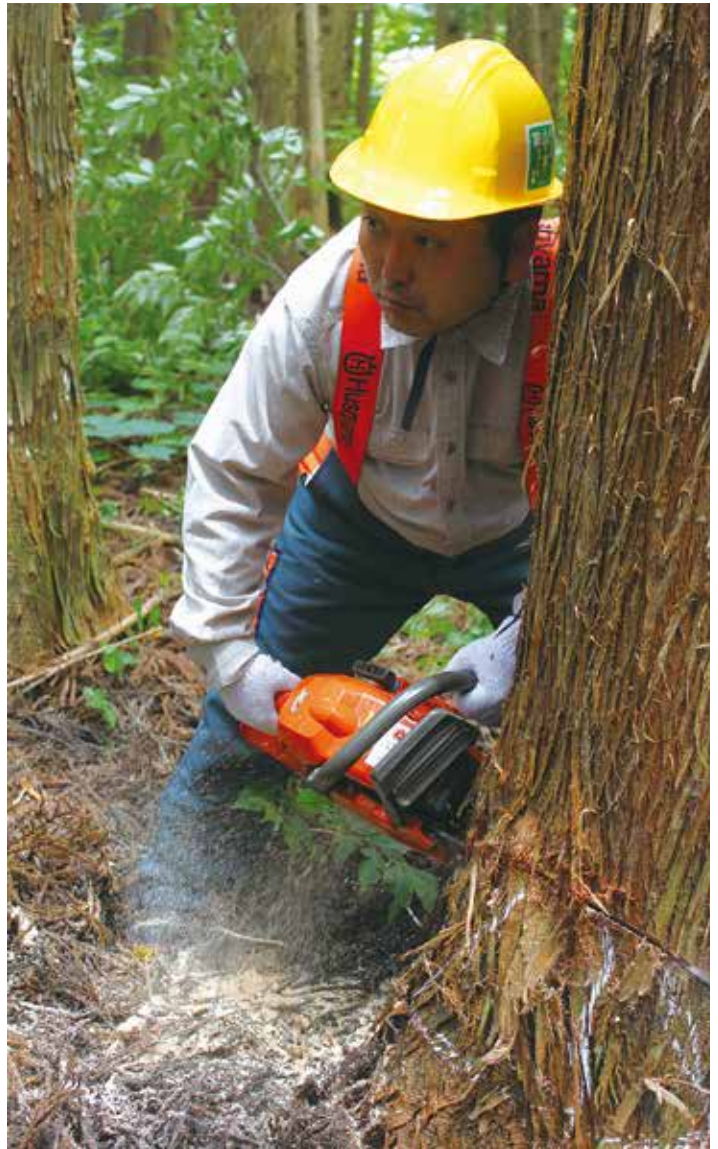
やや緊張した面持ちでいよいよ本番。最初は「受け口」をつける