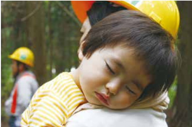
伐り倒したスギを前に、3月に完成予定の自宅に思いをはせる