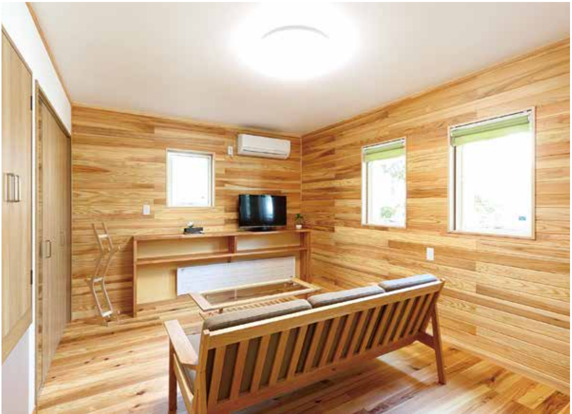
スギに囲まれた木の空間は、山小屋のような自然の安らぎを感じさせる

家は利子補給が受けられるという特典が付いていました。それで、柱はすべてヒバ、外壁のバラ板とか和室の畳の下地材などもヒバを使用したと聞いています。