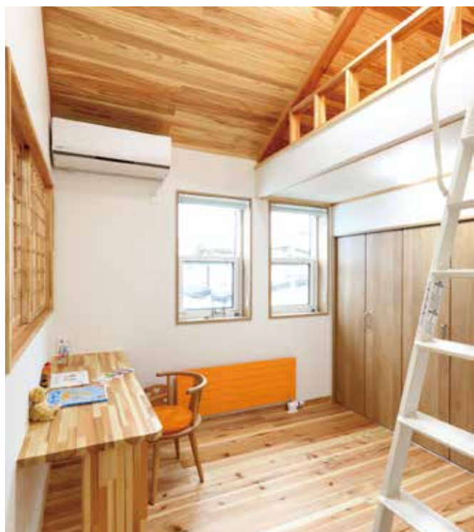
スギ集成材のカウンターを勉強机にした子供部屋

資料を持ってね。仮契約したという住宅会社との打ち合わせに使われていた資料です。間取り図もいっぱいあって、これではお客様が混乱するばかり、と思うほどでした。その土地と、そこに暮らすご家族に合う間取りはたった一つしかないのです。それをじっくりと時間をかけて探し出しましょう、と提案させていただきます。