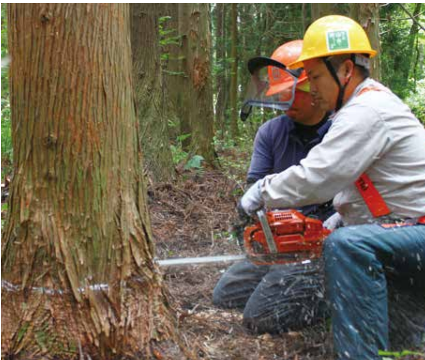
講師から指導を受けながら伐る。噴き出たオガ屑が膝に降りかかる

信条のようだ。 「熊の目撃情報が寄せられました」——頭上にアナウンスが流れた。チェーンソーを止めて耳を澄ます。「今日午前8時頃、(むつ市)北関根の……」。防災無線