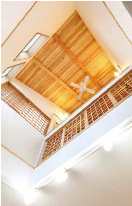
吹き抜け部分の白い壁は、2階のホールからプロジェクターで映画を映すスクリーンにもなっている

注：低炭素住宅 建築物の新築等の計画が「省エネ法」に定めた省エネ基準に比べ、一次エネルギー（石油など自然界のエネルギー）消費量を10%以上低減するなど低炭素化を促進するための基準に適合しており、所管行政庁の認定を受けた建築物のこと。