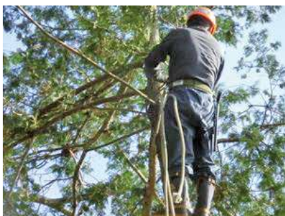
通路に面した箇所は木は倒すのは危険なので業者がロープを使って“吊るし切り”をする

PACS Perfect Architecture Consulting System