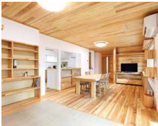
木の温もりに包まれたリビングは、ご家族の癒しのスペース