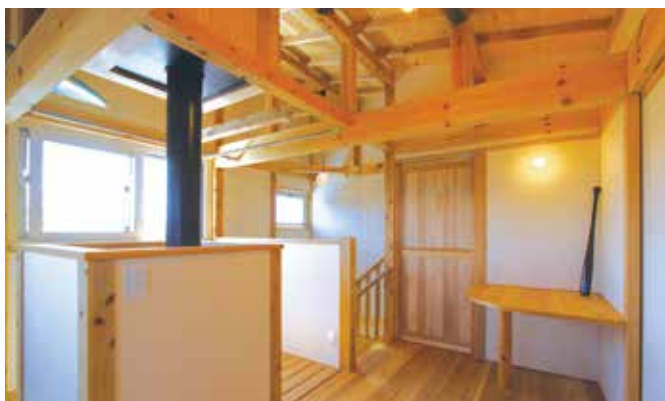
階段ホールのテーブルに飾っているのは、ご主人が朝野球で獲得したという津軽塗りのバット

望者はもらいに行ってく下さい」と。管轄する河川国道事務所からの情報を、くべる部を通じて発信してくれているんです。それを見て軽トラで頂戴に行くんですよ。