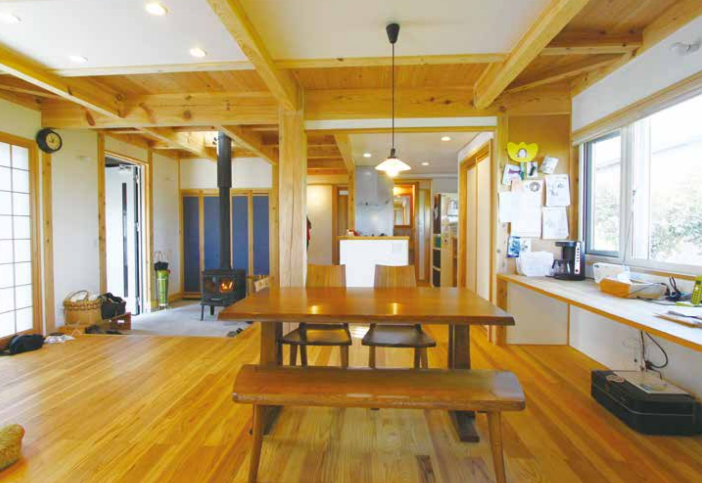
薪ストーブの暖房効率を考えたという区切りのない開放的な空間