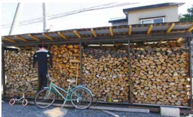
「くべる部」を通じて調達した薪

「ご主人の話 「くべる部」(薪ストーブ)愛好会、関連1222ページ)のブログから情報を得るんです。たとえば、鶴田町の岩木川河川敷で木を切るから、「希