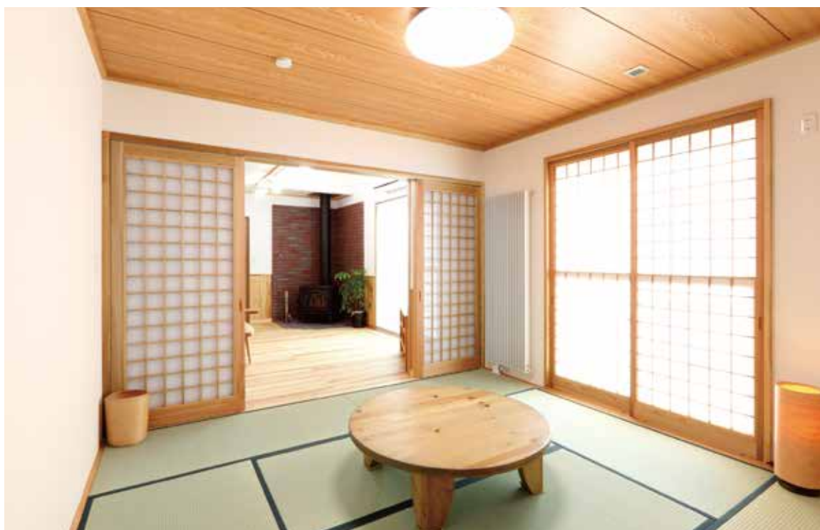
落ち着いた佇まいを見せるリビング続きの和室