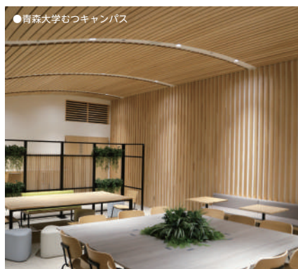
●青森大学むつキャンパス