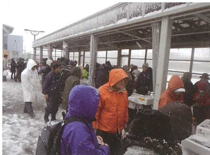
『3の市』年末特別開催（12/18）