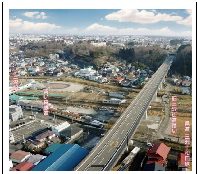
【現況写真(三沢大橋)】