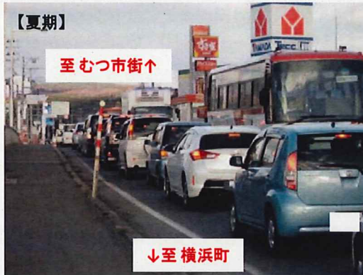
① 県道下北停車場線(中央二丁目交差点～下北町交差点)の渋滞状況