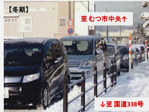
③ 一般国道279号(栗山トンネル東側交差点～榎川目交差点)の渋滞状況