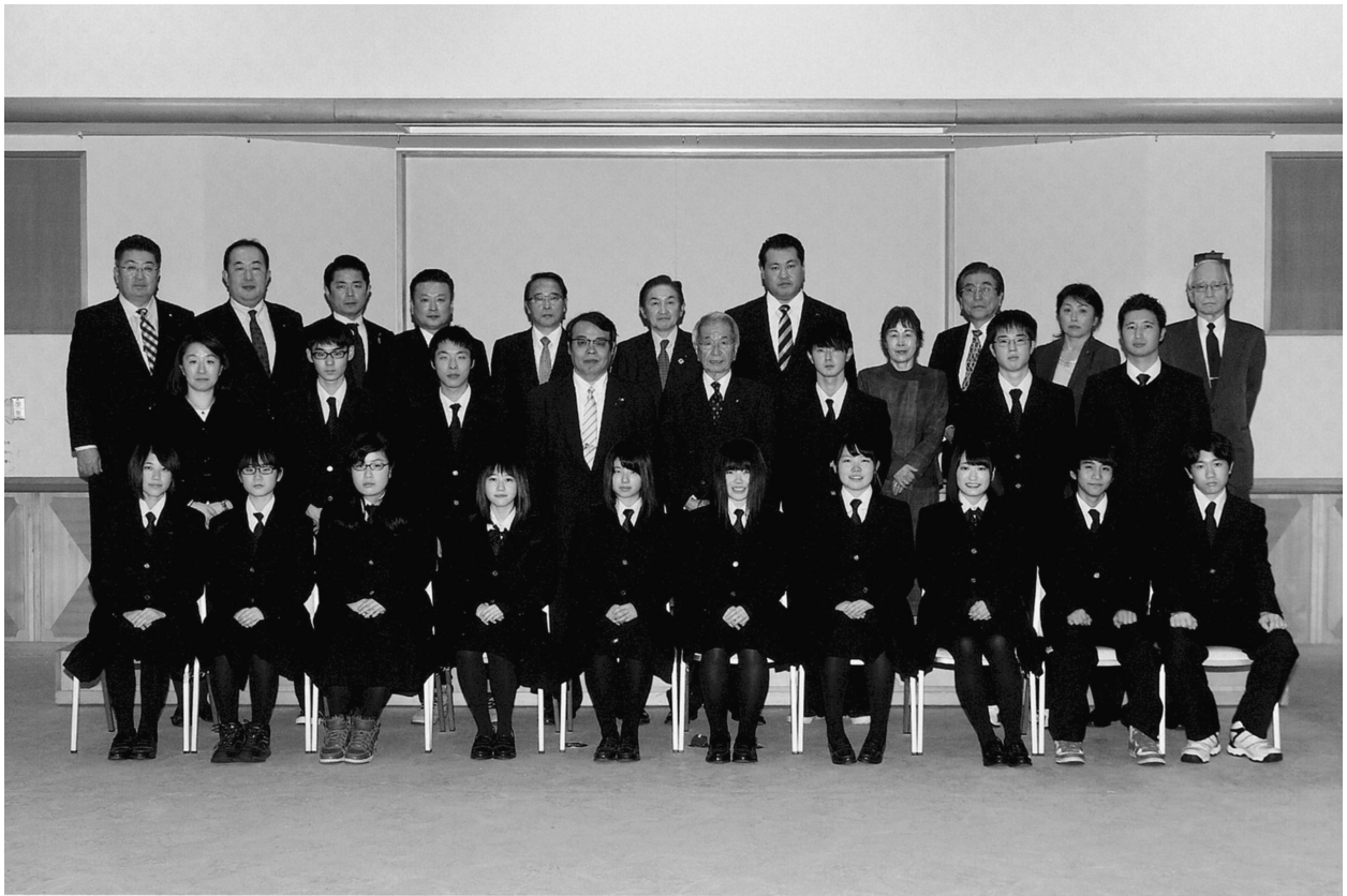
第1回高校生模擬議会参加 八戸工業大学第二高等学校 平成29年2月9日(木)