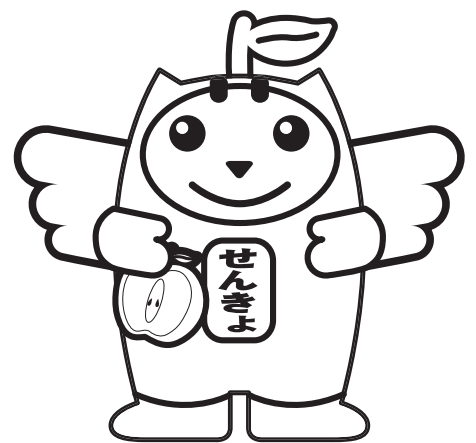
りんご 林檎っこめいすいくん