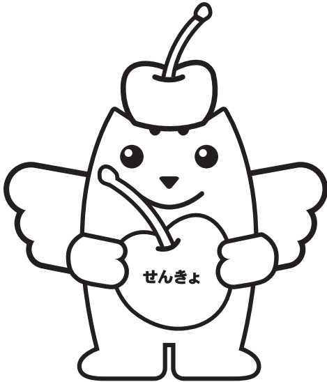
ジュノハートめいすいくん