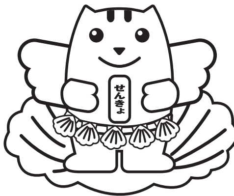
う ほたてから生まれためいすいくん