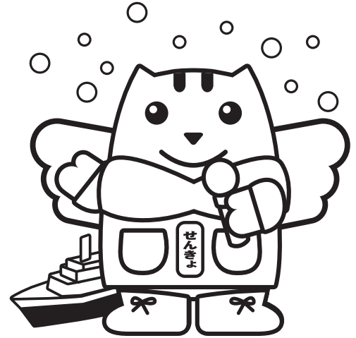
つがるかいきょう 津軽海峡めいすいくん