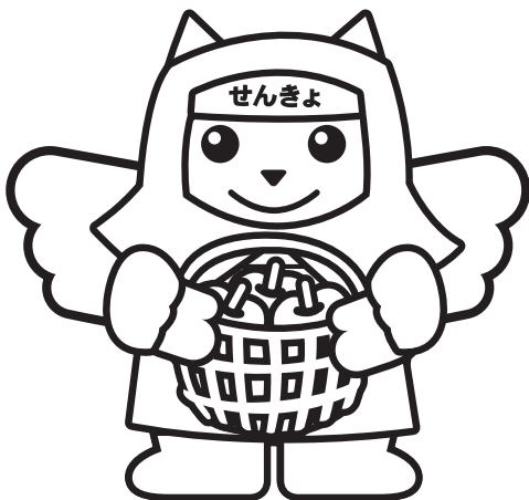
のうか りんご農家めいすいくん