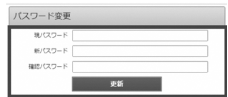
(パスワード変更画面)