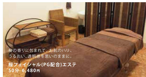
桜の香りに包まれて。お肌のハリ、うるおい、透明感を思いのままに。 桜フェイシャル(PG配合)エステ 50分 6,480円

ティートリーとラベンダーのオーガニックエッセンスオイル アロマクリーム PG Hirataさんオリジナルコスメ