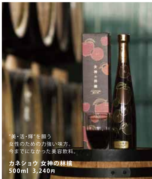
“美・活・輝”を願う女性のための力強い味方。今までになかった美容飲料。

プロテオグリカン配合の黒りんご酢「女神の林檎」の熟成樽を見学に！「女神の林檎」はお酢の疲労回復効果のほかに、プロテオグリカン配合だから美容や関節ケアも期待ができ、サイクリングの疲れを取るには最適の飲料です。ソーダで割ったり果物にかけたり、使い方もいろいろ！シャンパンに入れてオシャレに楽しむのもオススメですか！